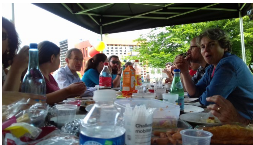
Pique-nique entre parrain et filleul, Stanley Black & Decker et Handishare

Établissements ayant parrainés un grand nombre d'autres structures